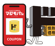
ド情ちゃんのおごり