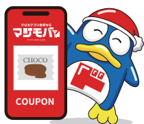
ドンペンのおごり