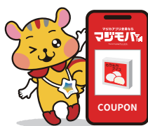
アピタンのおごり